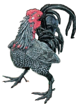
伊藤若冲「動植綵絵 南天雄鶏図」模型 (株式会社海洋堂 制作)