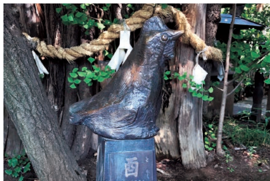
川崎市稲毛神社の十二支の「酉」レリーフ

十二支の酉はどうして鶏と漢字が違うのでしょうか？酉を含む十二支にまつわる小話など、知っているようで実はあまり知られていない「酉」について紹介します。