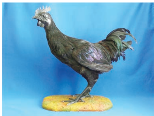
インドネシア原産のニワトリの品種アヤムセマニ

2017年、酉年にちなみ、これまで人と鳥がどのような関わりを持ってきたのか、鳥に対する様々な「視点」をテーマに展示を行います。ニワトリの多様な品種の標本や、鳥が描かれた図譜などを通して、野生動物としての「鳥」、暦としての「酉」、家禽としての「鶏」、芸術の対象としての「とり」の4つのコーナーに分けて紹介します。