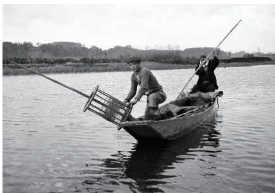
手賀沼で行われていたカモ類の流しもち縄猟

人と鳥が出会ってから現在に至るまで、どのような関係が続いてきたのでしょうか。狩猟道具等の展示を通して野生の鳥との様々な関わりについて紹介します。