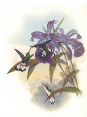
ジョン・グールド『鳥類図譜』原本 オジロエメラルドハチドリ